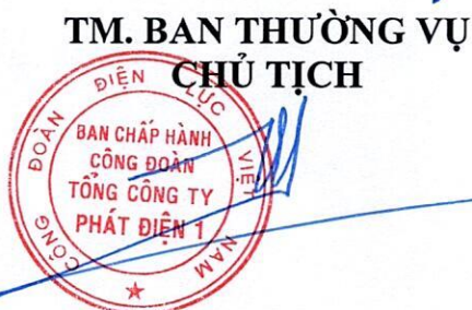
Trần Doãn Thành